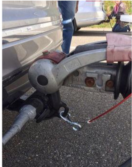
Korrektes Anbringen direkt am Fahrzeug (mit Öse).

Im Falle einer abnehmbaren Anhängerkupplung muss die Stahlstrippe anders-orts direkt am Fahrzeug angebracht werden (zum Beispiel an der Traverse un-ter dem Stossfänger).